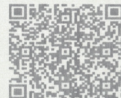
工程质量监督登记证书