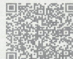
人防质量监督登记证书