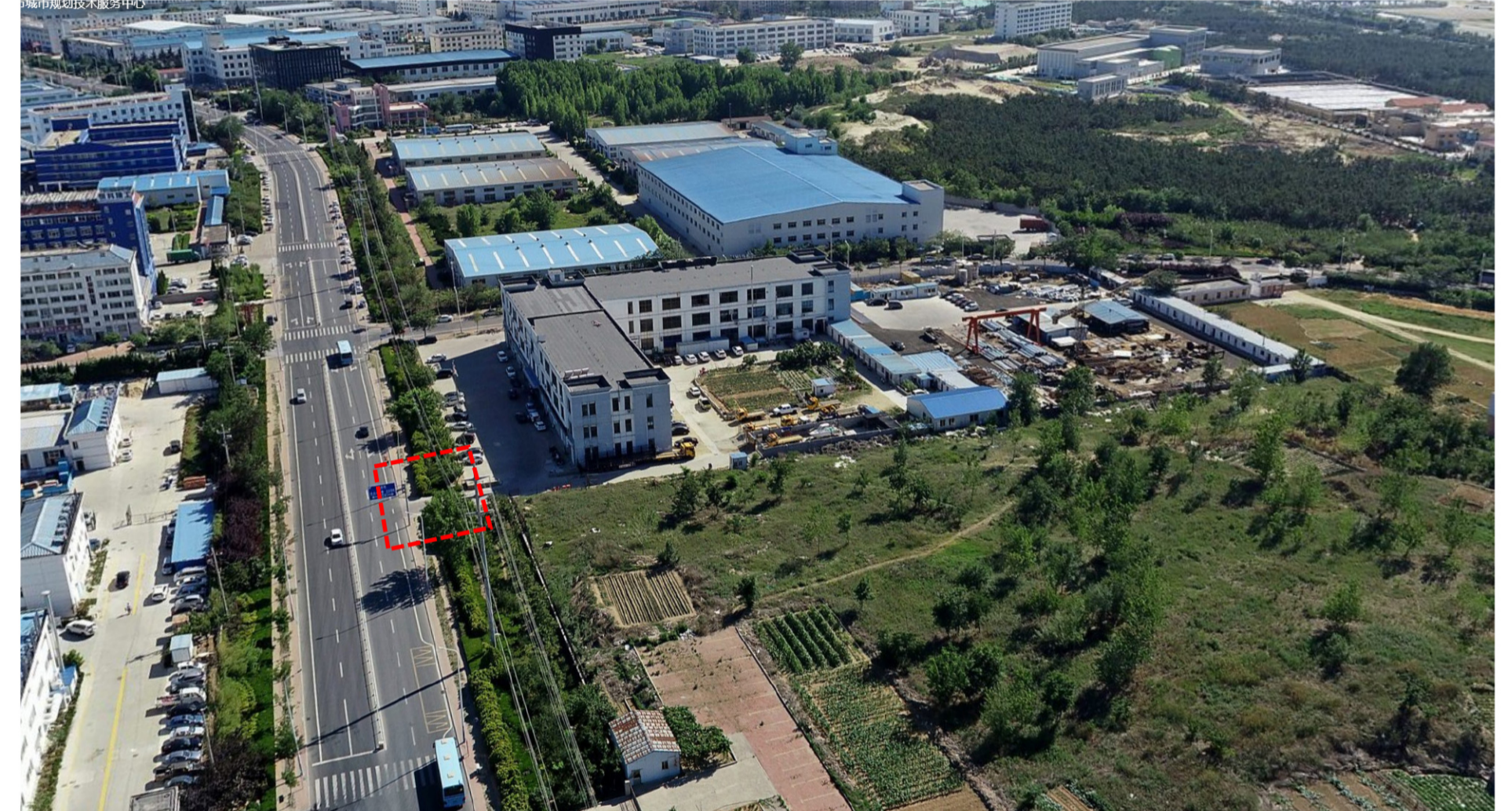
增设1号地块出入口前